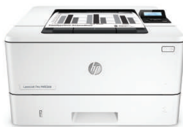
HP LaserJet Pro M402dn

Druckleistung und zuverlässige Sicherheit, angepasst an Ihre Arbeitsweise. Mit diesem leistungsfähigen Drucker können Sie Aufgaben schneller erledigen und Ihre Daten vor Bedrohungen schützen. 1 Original HP Tonerkartuschen mit JetIntelligence sorgen für eine höhere Reichweite. 2