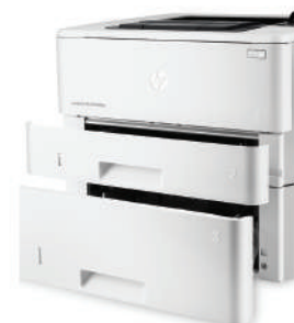
HP LaserJet Pro M402dn mit optionaler 550-Blatt-Papierzuführung